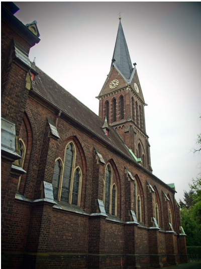
Pfarrkirche St. Joseph in Solingen-Ohligs