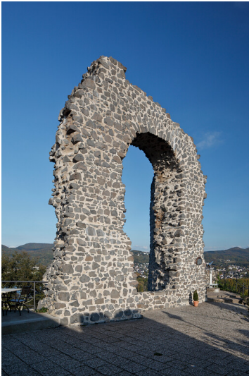
Rolandsbogen in Remagen-Rolandseck (2011)