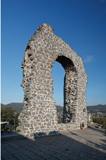
Rolandsbogen in Remagen-Rolandseck (2011)