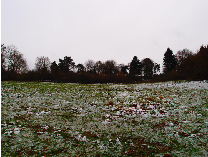
Ackerterrassen bei Dahlem (2015)