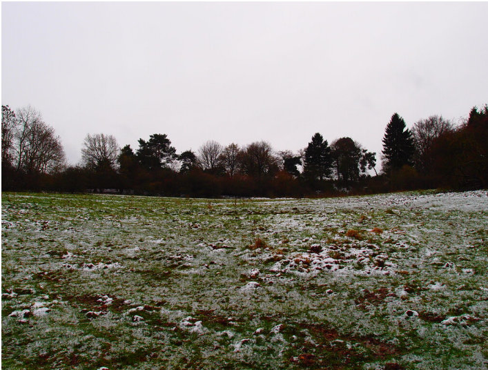
Ackerterrassen bei Dahlem (2015)