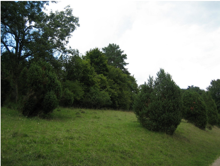
Ackerterrasse bei Blankenheim-Alendorf mit Wacholderbüschen und Laubbäumen (2015).