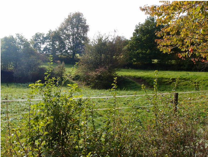
Ackerterrassen bei Schleiden-Olef mit linearen Gehölzformationen parallel zur Hangkante (2015).