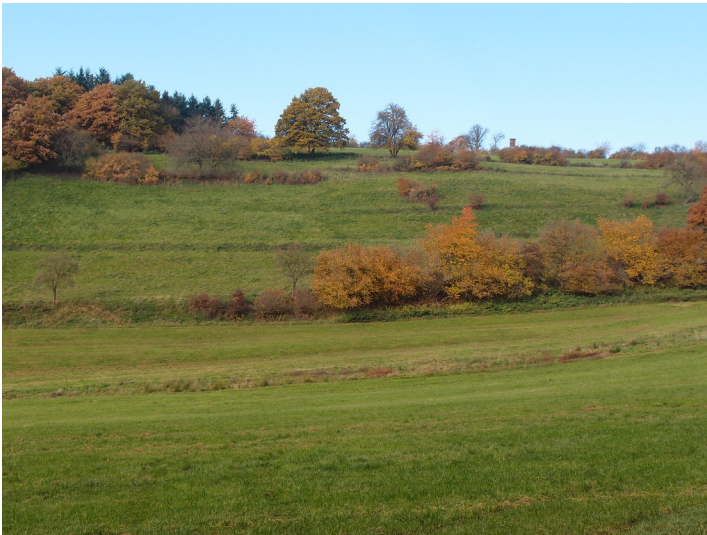
Ackerterrassen bei Bad Münstereifel-Eicherscheid mit linearen Gehölzformationen parallel zur Hangkante (2015).