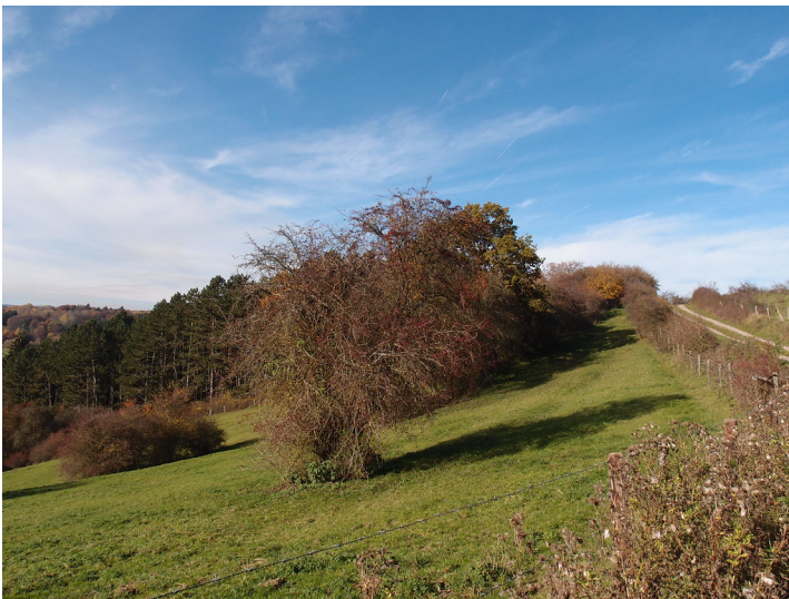
Ackerterrassen bei Blankenheim-Lommersdorf mit linearen Gehölzformationen parallel zur Hangkante (2015).