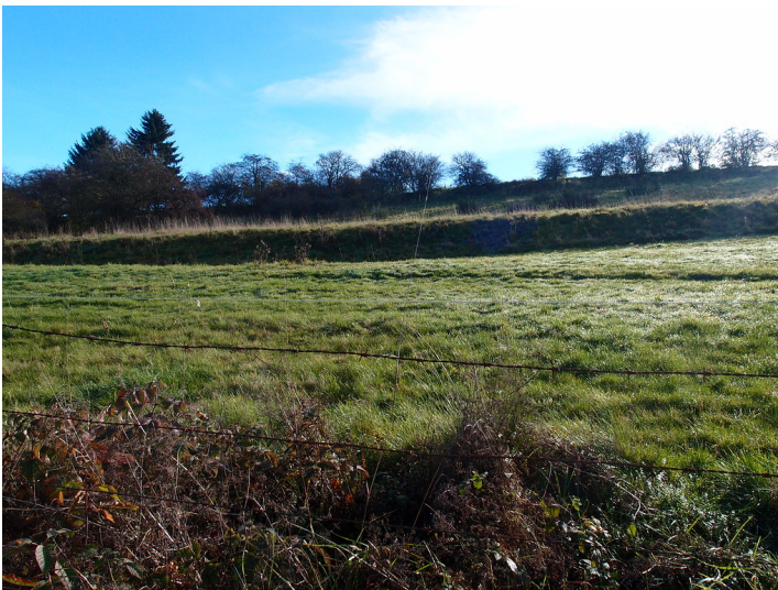
Ackerterrassen bei Blankenheim-Lommersdorf mit linearen Gehölzformationen parallel zur Hangkante (2015).