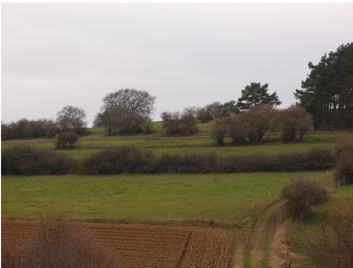
Ackerterrassen bei Blankenheim-Dollendorf mit linearen Gehölzformationen parallel zur Hangkante (2015).

Schlagwörter: Ackerterrasse , Grünland , Stufenrain Fachsicht(en): Kulturlandschaftspflege, Naturschutz Gemeinde(n): Blankenheim (Nordrhein-Westfalen) Kreis(e): Euskirchen Bundesland: Nordrhein-Westfalen