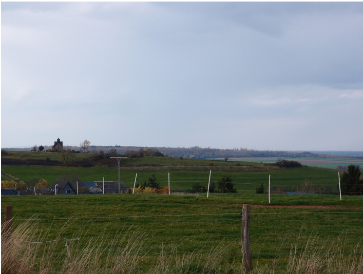
Ackerterrassen bei Floisdorf (2015)