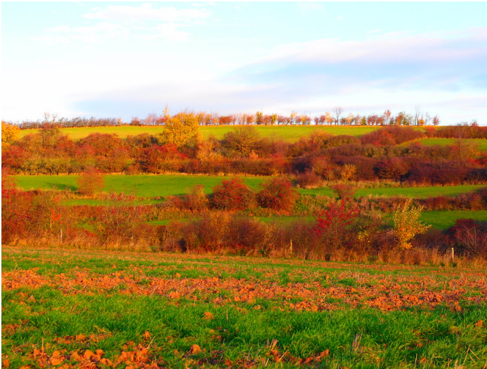
Ackerterrassen bei Glehn (2015)