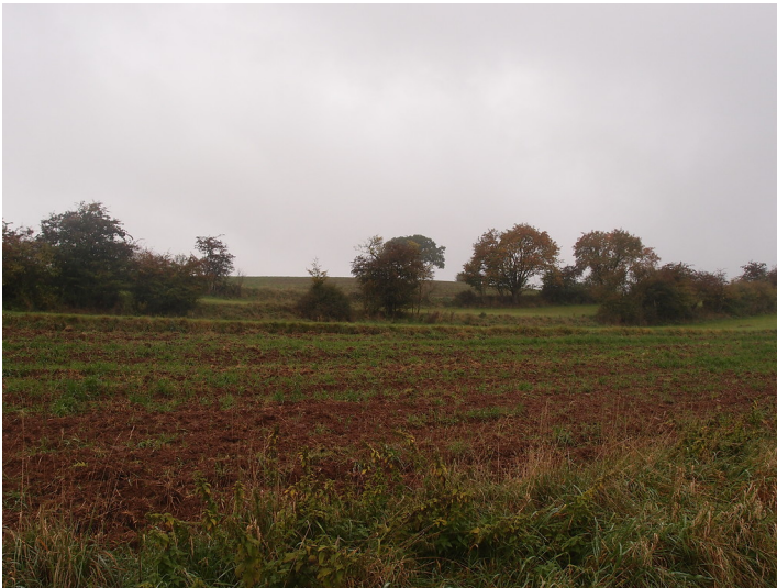
Ackerterrassen mit Einzelbüschen entlang der Hangkante bei Gemünd (2015).