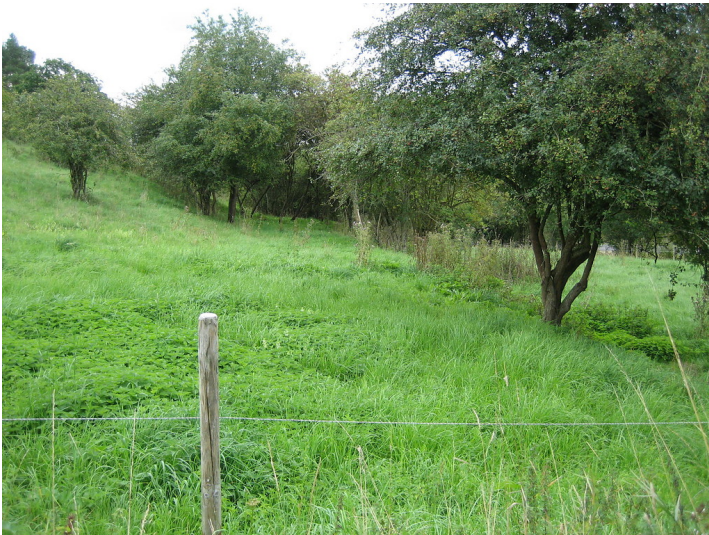
Seitlicher Einblick in Ackerterrassenstruktur bei Blankenheim-Uedelhoven mit linearen Gehölzformationen parallel zur Hangkante (2015).