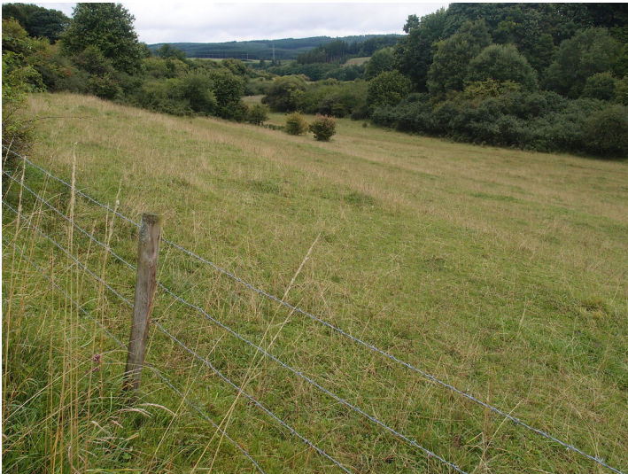
Ackerterrassen bei Blankenheim mit wenigen, linearen Gehölzformationen parallel zur Hangkante (2015).