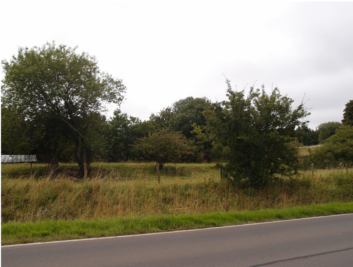
Ackerterrassen bei Blankenheim mit linearen Gehölzformationen parallel zur Hangkante (2015).