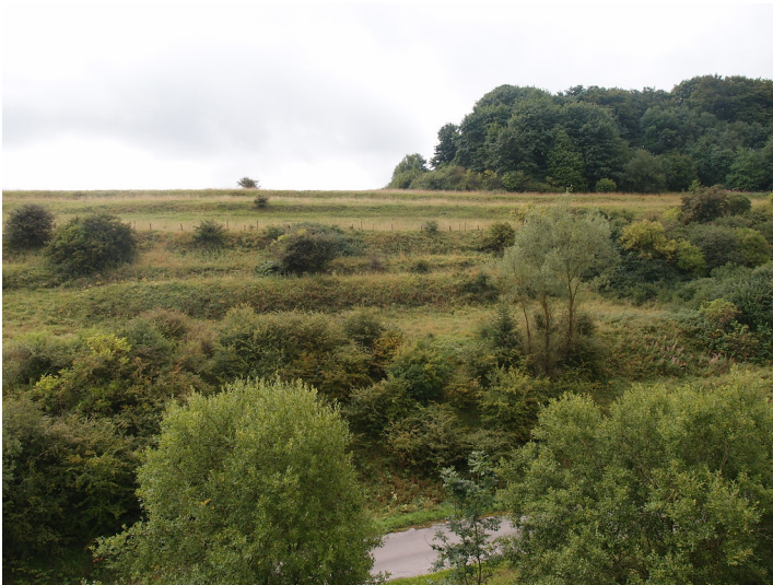
Ackerterrassen bei Blankenheimerdorf mit linearen Gehölzformationen parallel zur Hangkante (2015).