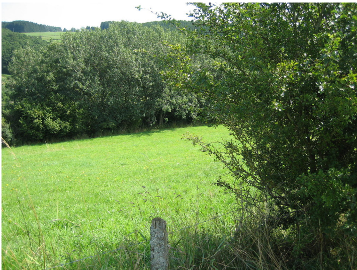
Blick auf eine Ackerterrasse bei Dahlem mit stark verbuschter Hangkante (2015).