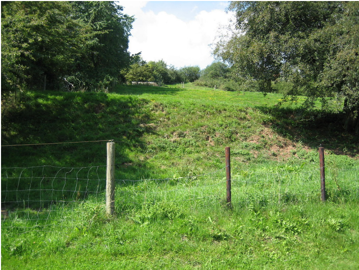
Ackerterrassen bei Dahlem mit Bäumen an Hangkante (2015).