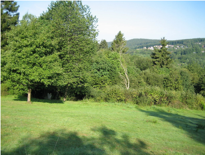
Ackerterrasse bei Kronenburgerhütte mit linearer Gehölzformation parallel zur Hangkante (2015).