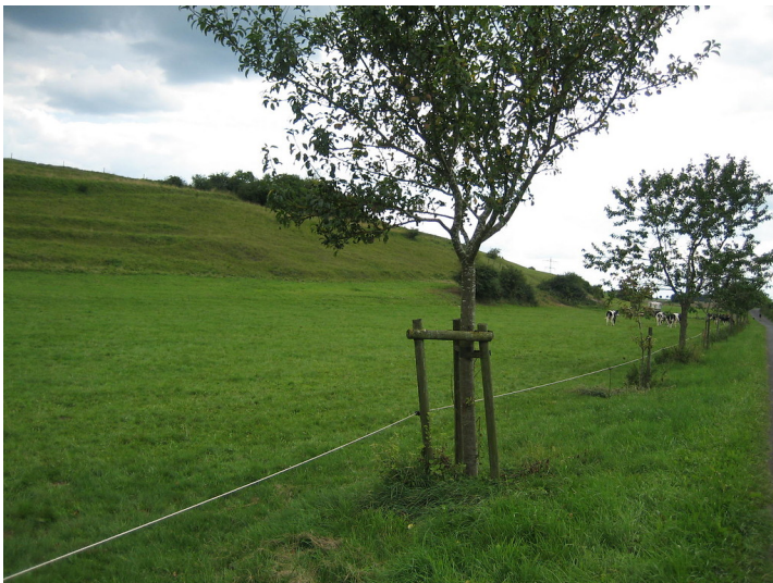
Ackerterrassen bei Dahlem mit linearen Gehölzformationen an unterster Terrassenstufe parallel zu einem befestigten Feldweg (2015).