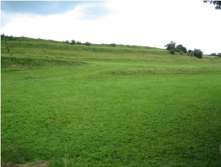
Ehemalige, stufenförmig ansteigende Ackerterrassen unter Grünland bei Dahlem (2015).