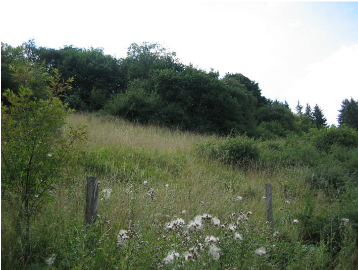
Verbuschte Ackerterrassen mit linearen Gehölzformationen parallel zur Hangkante (bei Barhaus, 2015).