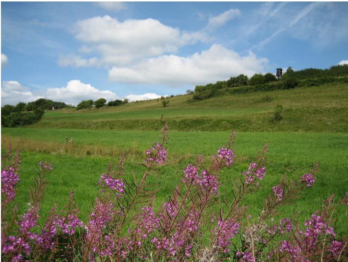
Ehemalige Ackerterrassen mit Begrünung dienen als Wiese oder Weide (bei Nettersheim, 2015).