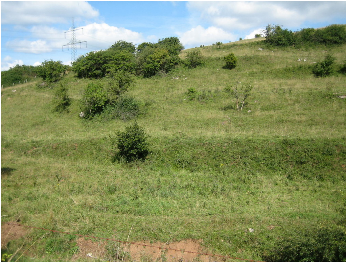
Ackerterrassen mit Einzelbüschen an der Hangkante (bei Nettersheim, 2015).