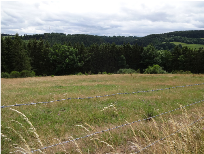
Ackerterrassen bei Hellenthal mit wenigen Gehölzen parallel zur Hangkante (2015).