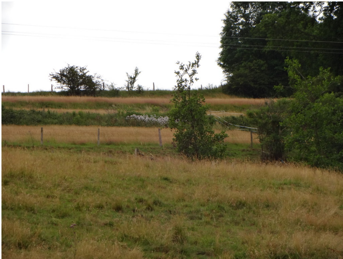
Ackerterrassen bei Hellenthal mit Einzelbüschen an der Hangkante (2015).