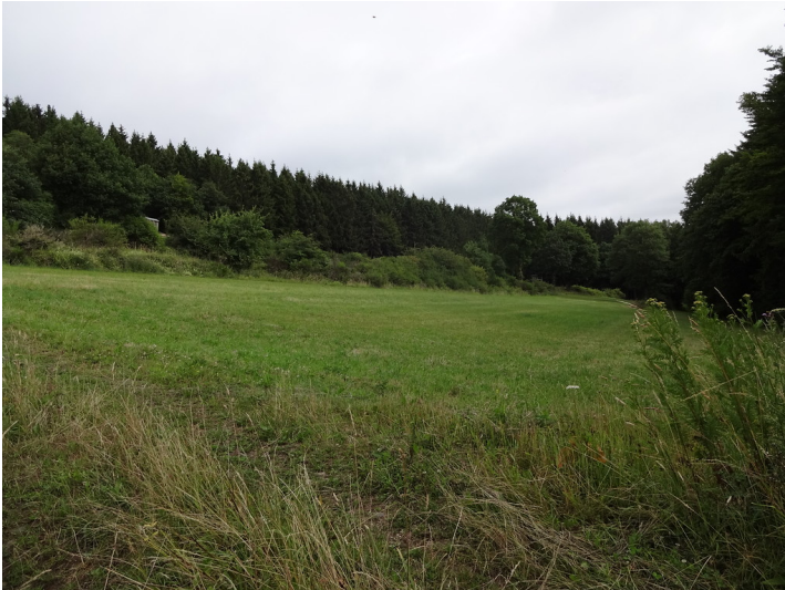
Ackerterrassen bei Hollerath mit linearen Gehölzformationen parallel zur Hangkante (2015).