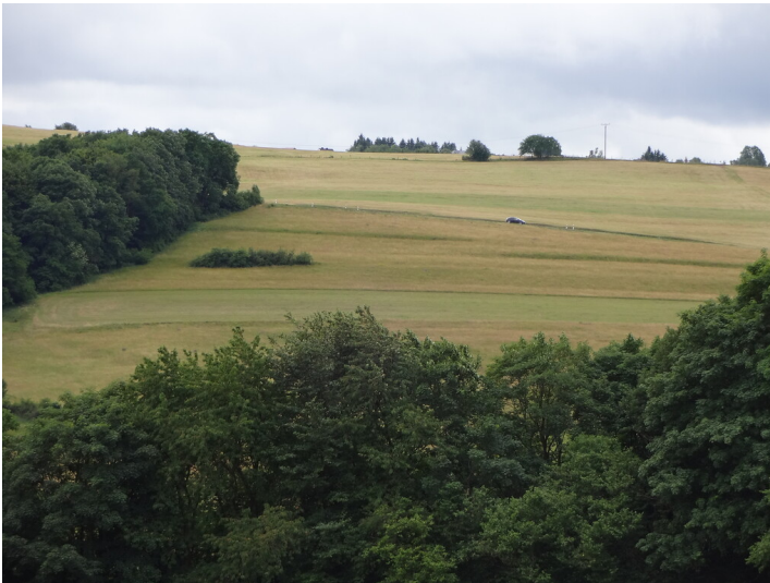
Ackerterrassen bei Hecken (2015)