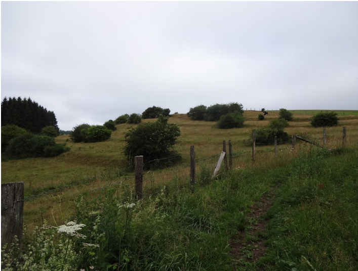
Ackerterrassen mit Einzelbüschen parallel zur Hangkante bei Ramscheid (2015).