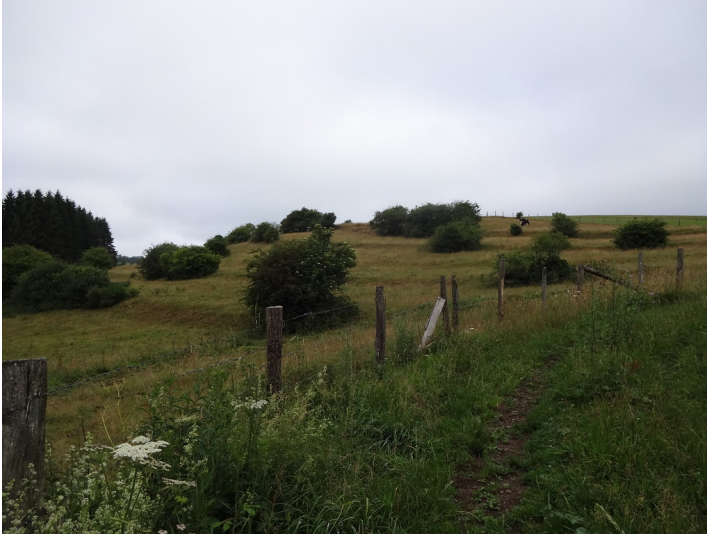
Ackerterrassen mit Einzelbüschen parallel zur Hangkante bei Ramscheid (2015).