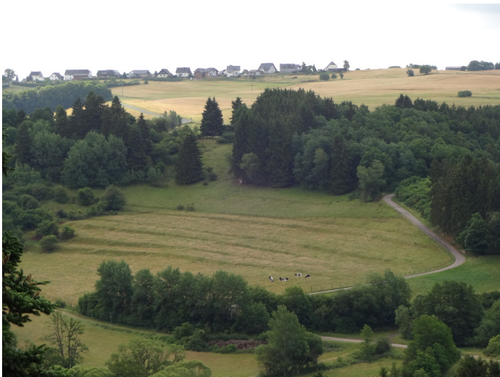
Ehemalige Ackerterrassen mit Rinderbeweidung bei Hellenthal-Wildenburg (2015)