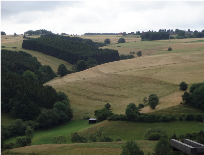
Ackerterrassen bei Hellenthal-Wildenburg mit grasbewachsener Hangkante (2015).