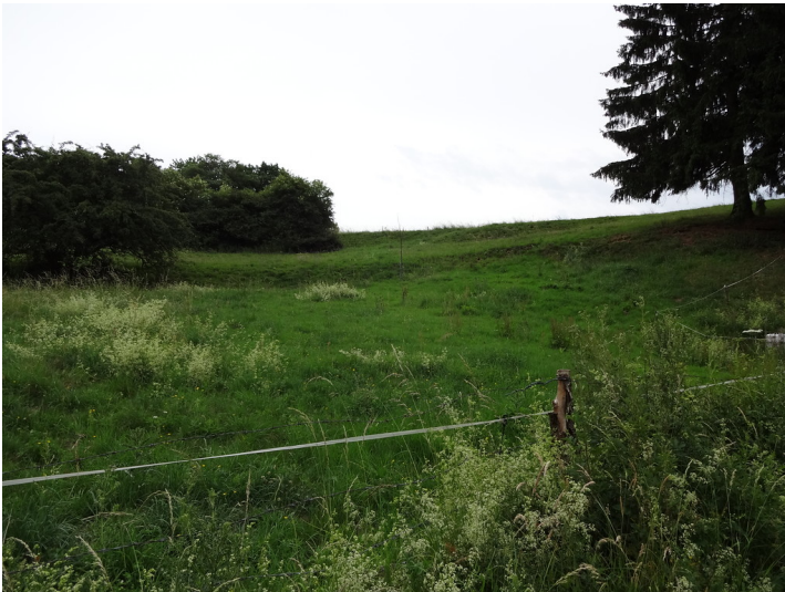
Ackerterrassen bei Kall-Frohnrath mit linearen Gehölzformationen parallel zur Hangkante (2015).