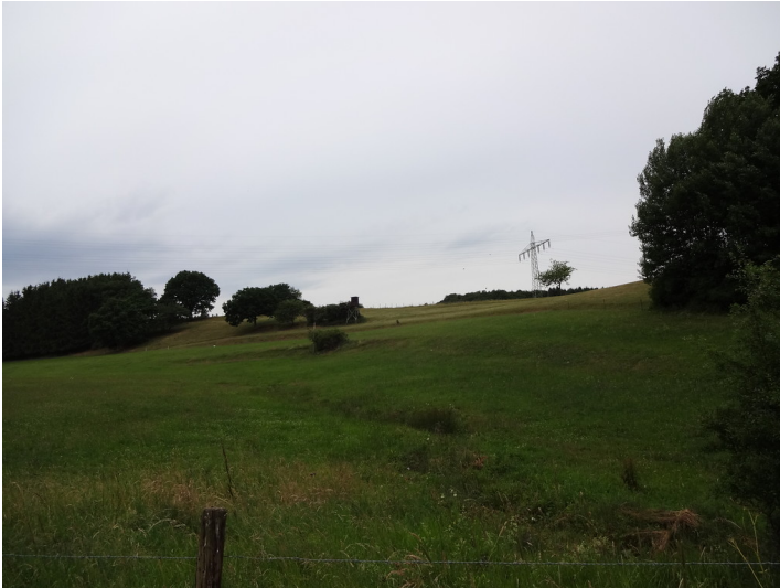
Ackerterrassen bei Kall-Frohnrath mit wenigen, linearen Gehölzformationen parallel zur Hangkante (2015).