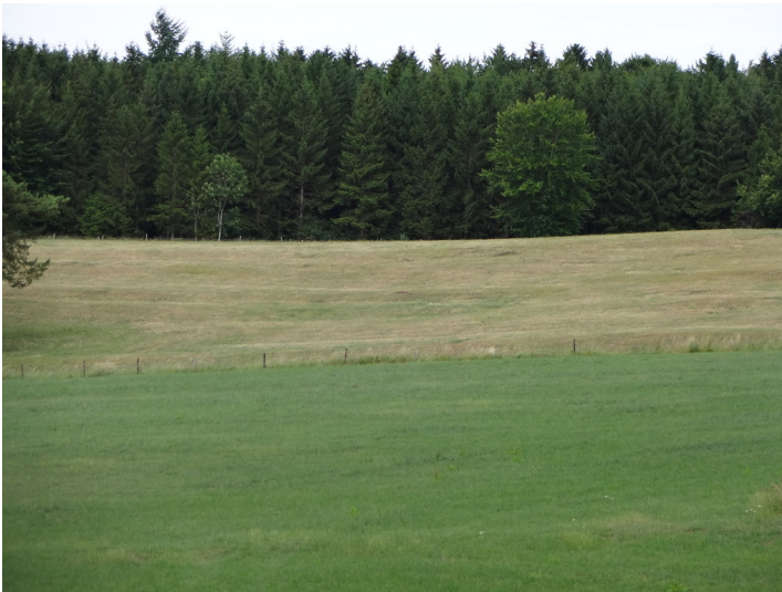
Schwach ausgeprägte Ackerterrassen bei Kall-Hövelshof mit grasbewachsener Hangkante (2015).