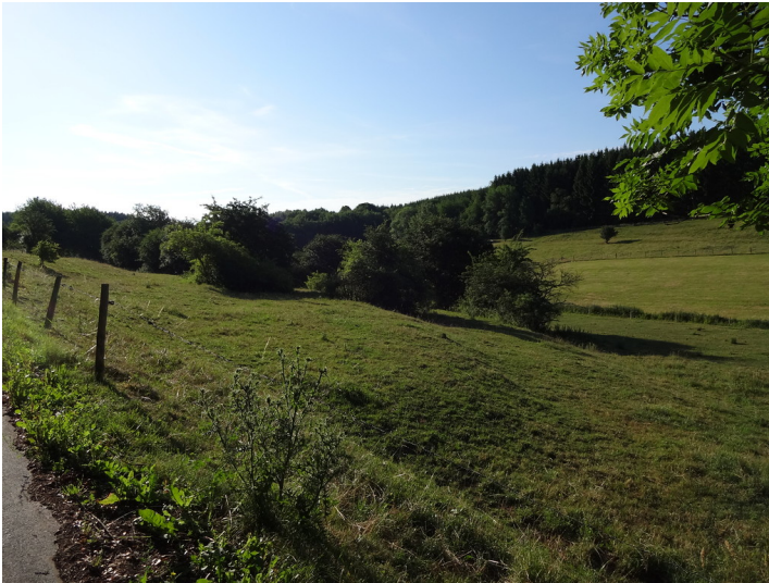
Ackerterrassen bei Rüth mit linearen Gehölzformationen parallel zur Hangkante (2015).