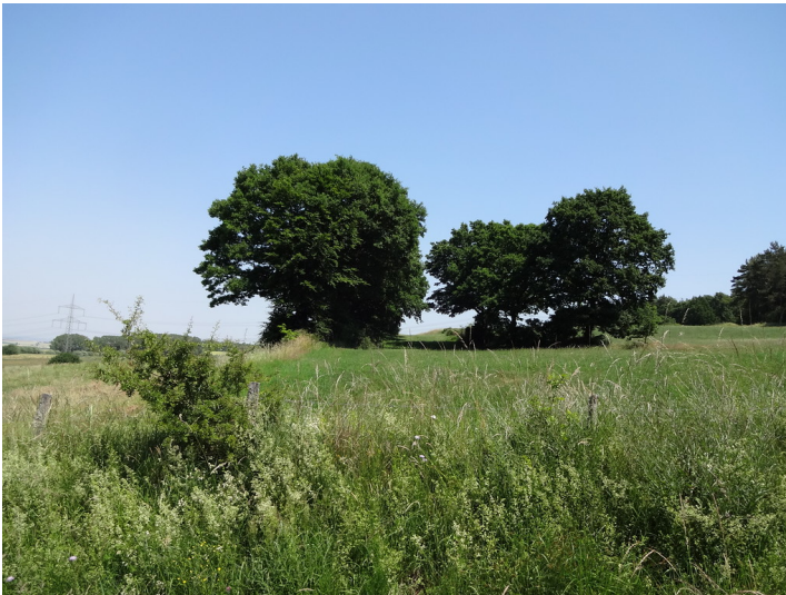
Ackerterrassen bei Kall mit linearen Gehölzformationen parallel zur Hangkante (2015).