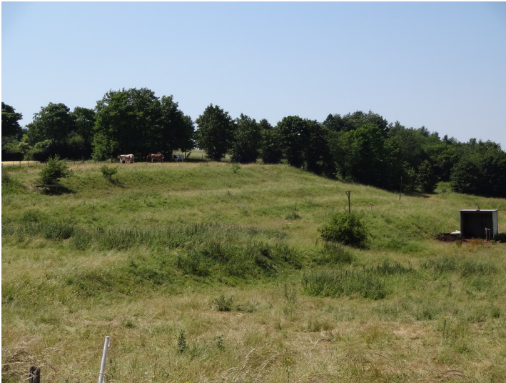
Ackerterrassen bei Kall-Keldenich (2015)