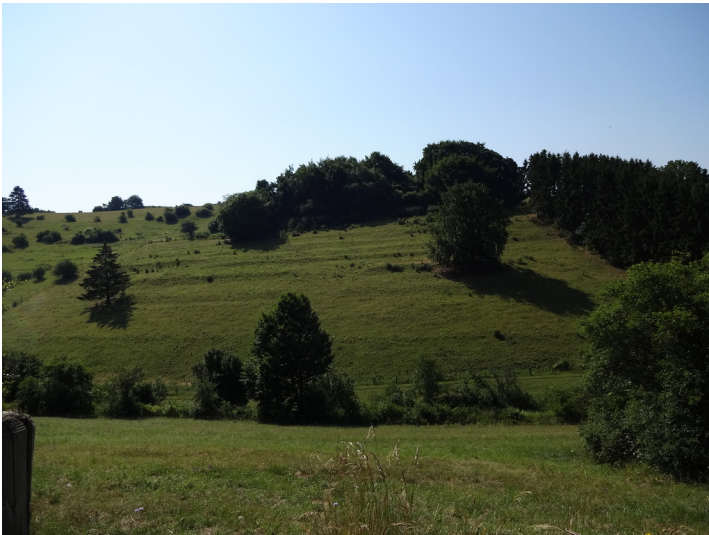
Ackerterrassen an Steinfelder Straße bei Wahlen (2015)