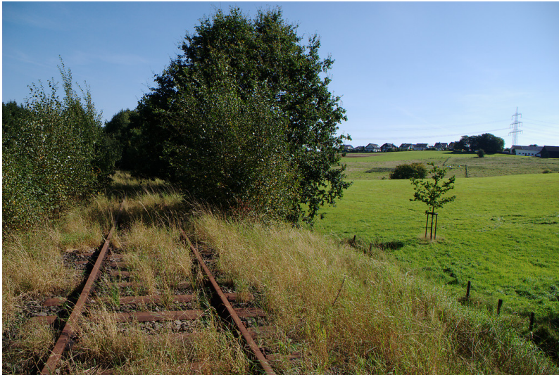
Schienen der Bahnlinie Wipperfürth - Lennep bei Busenbach (2007)