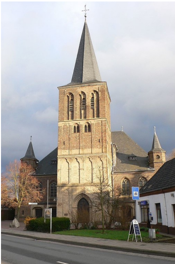
Die katholische Kirche Sankt Georg im Reeser Ortsteil Haldern (2011).