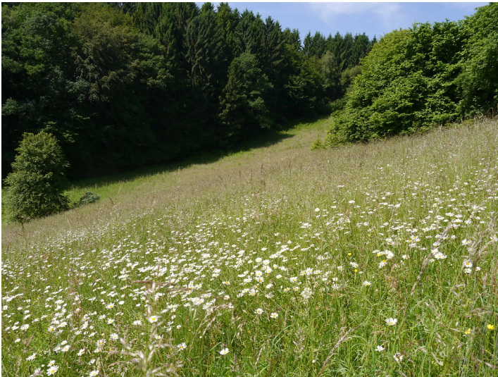
Steiler Magerhang am Dhünnenburger Busch bei Wermelskirchen (2016)