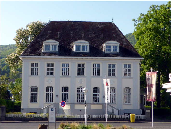
Nördliche Frontansicht der Villa Rütten in Bad Neuenahr (2018).