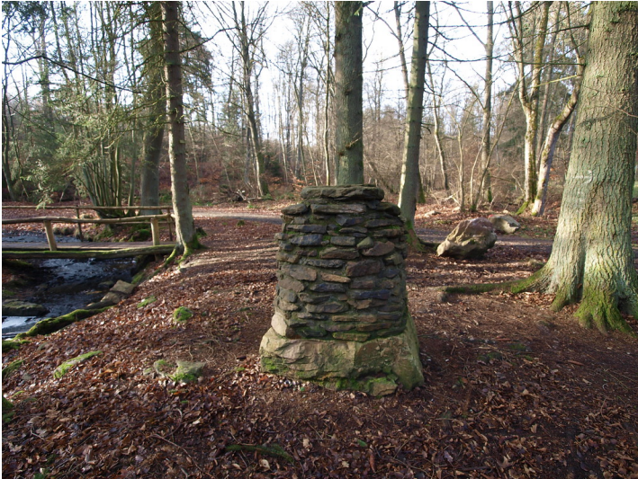
Rückansicht des Marienaltars am Seibersbach (2015). In der Bildmitte links fließt der Seibersbach.