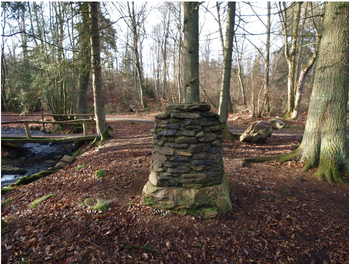
Rückansicht des Marienaltars am Seibersbach (2015). In der Bildmitte links fließt der Seibersbach.