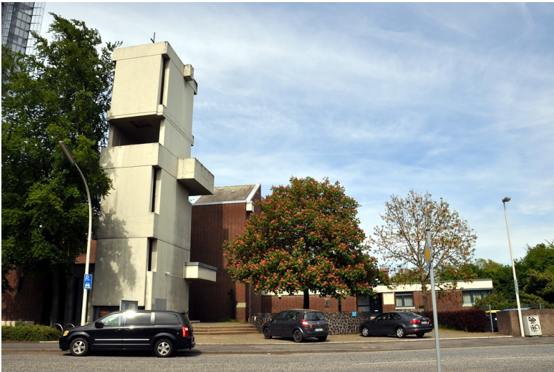
Katholische Kirche Sankt Winfried in Bonn (2016)