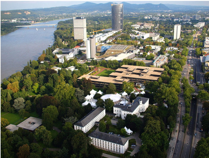
Luftbildaufnahme: Das frühere Regierungsviertel in Bonn zwischen Rhein und Adenauerallee / Willy-Brandt-Allee. Vorne ist das Palais Schaumburg mit dem dahinter liegenden früheren Bundeskanzleramt und den Bundestagsgebäuden zu sehen, dahinter das frühere Abgeordnetenwohnhaus "Langer Eugen" und der Post Tower vor dem Hintergrund des Siebengebirges (2010).