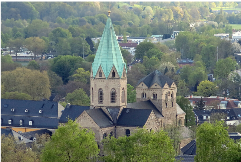
Die Pfarrkirche St. Ludgerus in Essen-Werden aus der Vogelperspektive (2015)