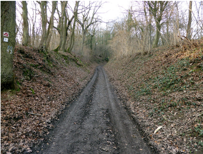
Hohlweg auf den Mühlenberg in Sinzig (2015)